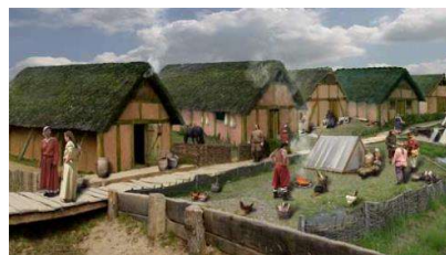
Woonhuizen Dorestad (Dorestadonthuld)