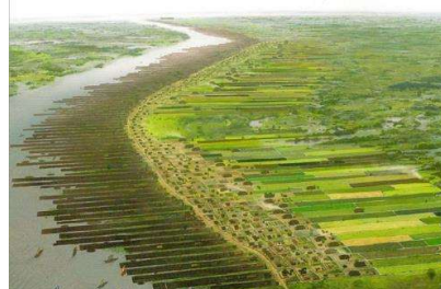
Dorestad: aanlegsteigers langs de oever van de Kromme Rijn